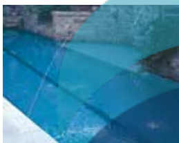
Un chorro de 3/16"