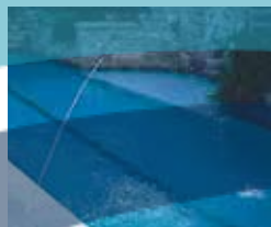
Un chorro de 1/4"