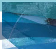
Un chorro de 5/16"